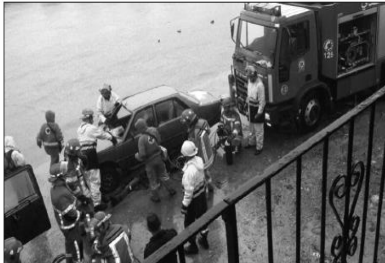
حساس الدفاع المدني والسليبي الأحمر والجميزة في أحسن المناورات